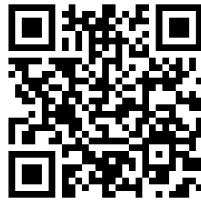
Настанова щодо встановлення